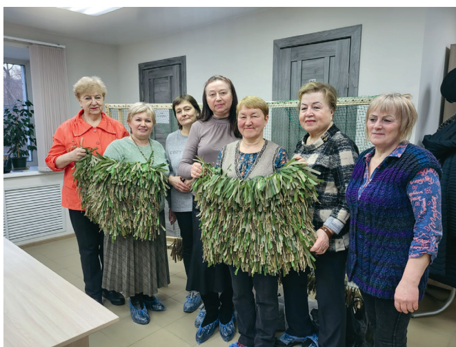
График работы волонтерского центра «32 округ – своих не бросаем»:

Наши ребята на передовой очень нуждаются в такой помощи. Приглашаем присоединиться всех неравнодушных рукодельниц округа. Обеспечим необходимыми материалами, поможем освоить технологию, если это потребуется. И передадим на фронт нашим землякам вещи, сделанные вашими руками с теплом и верой в победу!