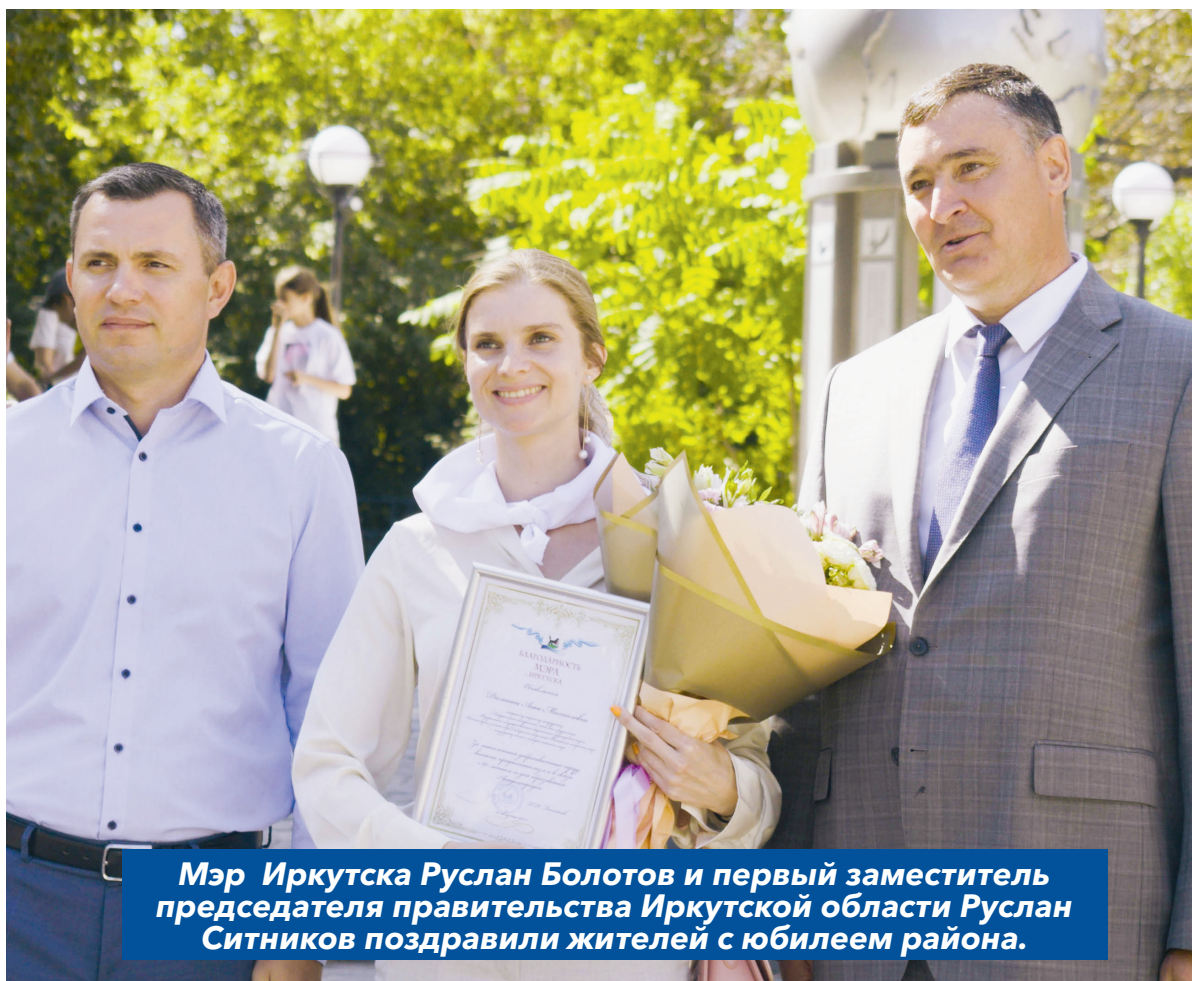
Мэр Иркутска Руслан Болотов и первый заместитель председателя правительства Иркутской области Руслан Ситников поздравили жителей с юбилеем района.