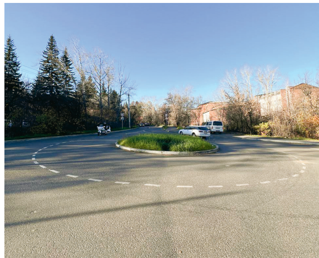
Ул. Фаворского. Кольцо.

по ул. Лермонтова со стороны жилой зоны Академгородка, на сквере школы №24, вокруг детской и спортивной площадок на Костычева, 10Б были высажены яблони, груши, черемуха. Санитарная и формовочная обрезка деревьев были проведены по улицам Фаворского, Мелентьева – на участке от Фаворского до Лермонтова, Помяловского, Белобородова, Костычева.